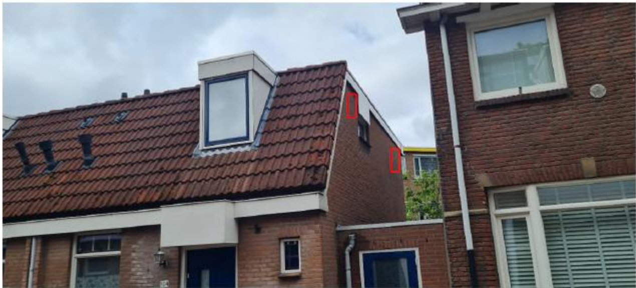
Figuur 2.8 Potentiële locaties van de permanente vlemuiskasten ter plaatse van Venestraat 104 te Leidschendam