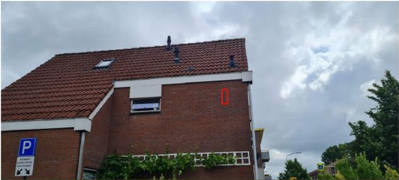
Figuur 2.11 Potentiële locaties van de permanente vleermuiskasten ter plaatse van Nieuwstraat 99 te Leidschendam