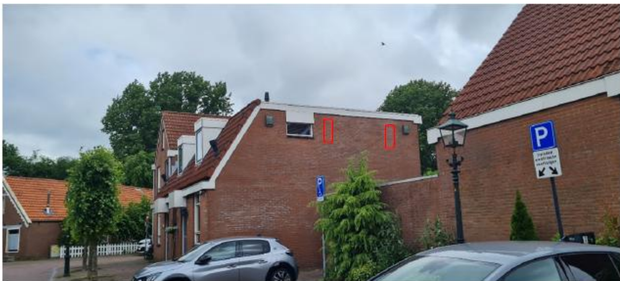
Figuur 2.4 Potentiële locaties van de permanente vleermuiskasten ter plaatse van Achterom 7 te Leidschendam