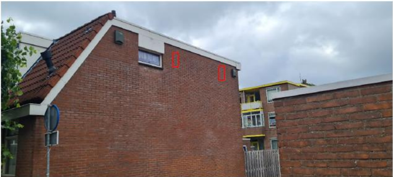
Figuur 2.6 Potentiële locaties van de permanente vleermuiskasten ter plaatse van Venestraat 90 te Leidschendam