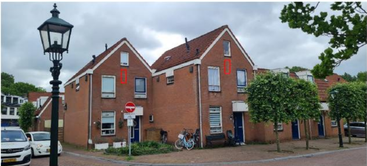
Figuur 2.3 Potentiële locaties van de permanente vleermuiskasten ter plaatse van Achterom 1 en 3 te Leidschendam