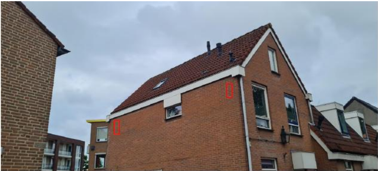
Figuur 2.9 Potentiële locaties van de permanente vleermuiskasten ter plaatse van Venestraat 110 te Leidschendam