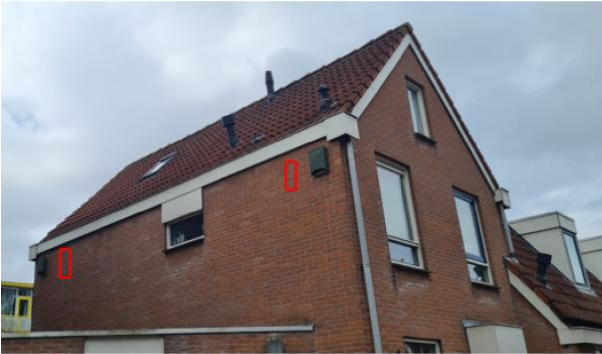
Figuur 2.7 Potentiële locaties van de permanente vlemuiskasten ter plaatse van Venestraat 98 te Leidschendam