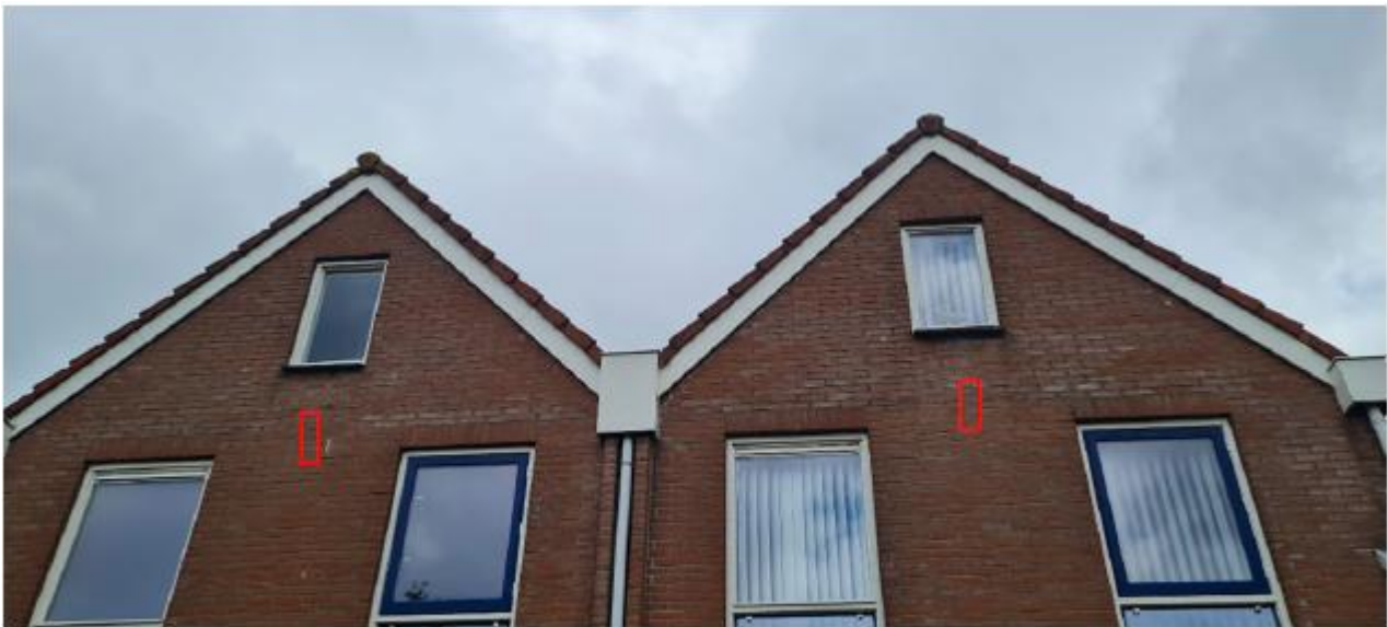
Figuur 2.10 Potentiële locaties van de permanente vleermuiskasten ter plaatse van Nieuwstraat 99 en 101 te Leidschendam