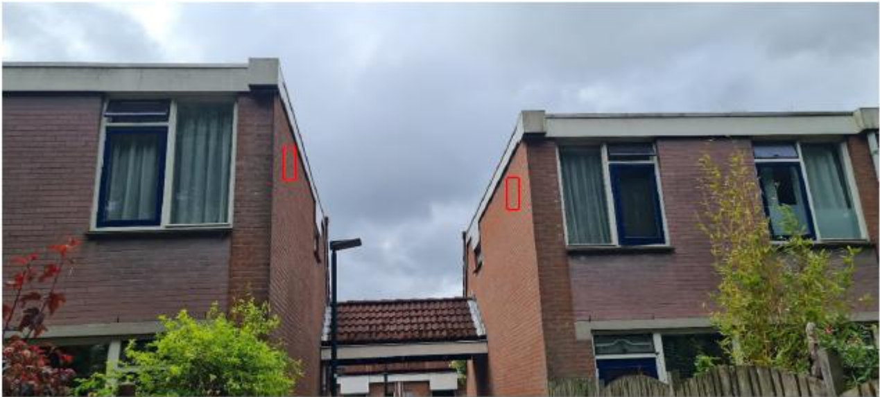
Figuur 2.5 Potentiële locaties van de permanente vleermuiskasten ter plaatse van Venestraat 69 en 71 te Leidschendam