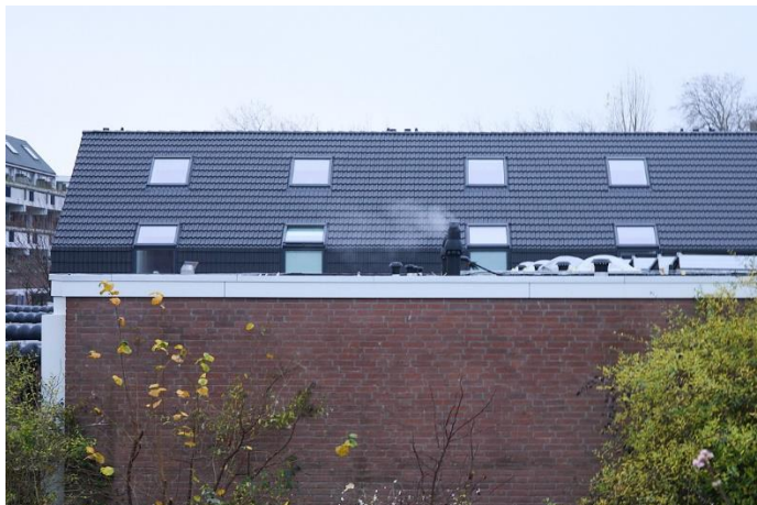
Na de werkzaamheden